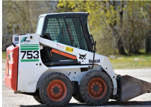
Bobcat, korvtõstuk, traktor MTZ