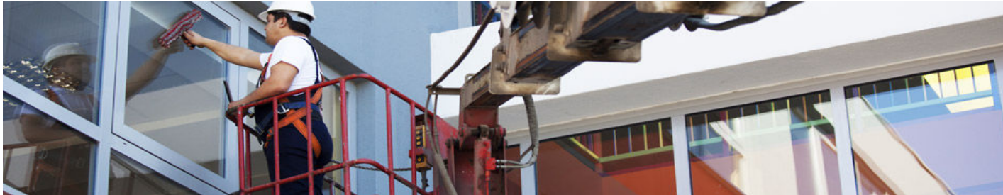
Akende pesemine, rõdupiirete ja katuste hooldamine