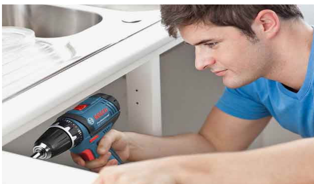
Kõik kodused remonttööd