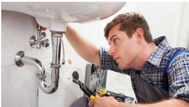
Kõik kodused santehnilised tööd